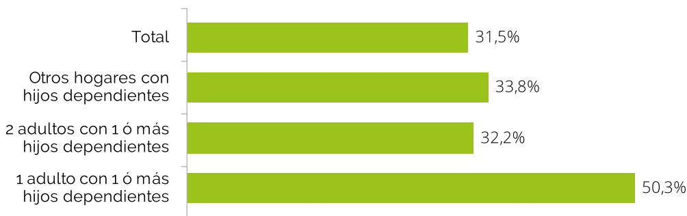
Gráfico 17. Tasa de riesgo de pobreza o exclusión social (tasa AROPE) según tipo de hogar. Andalucía, 2013