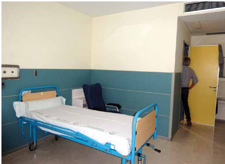
Imagen 63. UCH Sevilla-San Lázaro

son de loza y no de aluminio como hemos visto en una mayoría de este tipo de instalaciones.