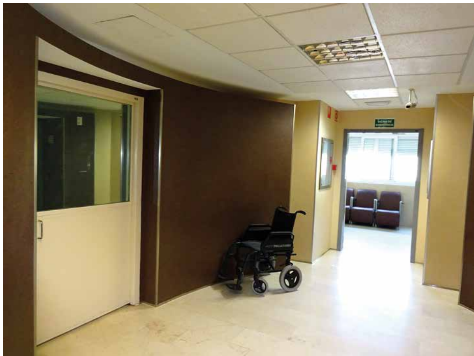
Imagen 62. UCH Sevilla-San Lázaro