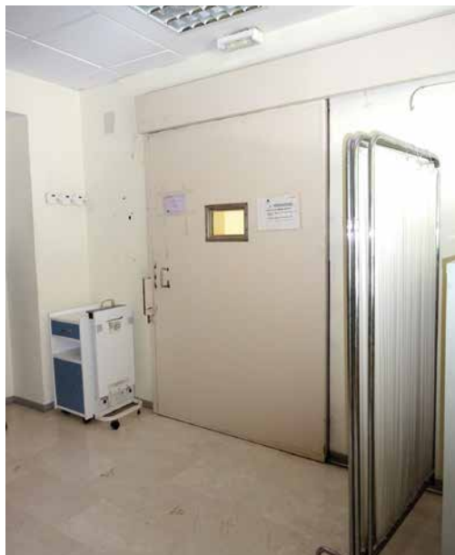
Imagen 65. UCH Sevilla-San Lázaro

y correderas con una ventana acristalada para vigilar el interior sin necesidad de proceder a la apertura de la puerta.