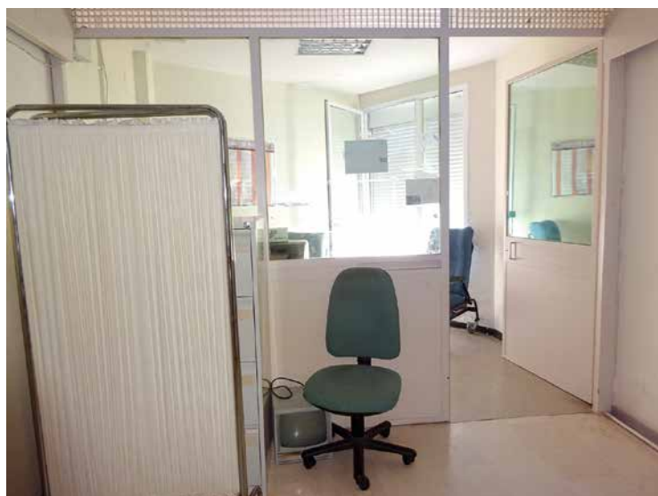
Imagen 66. UCH Sevilla-San Lázaro

Vigila el acceso a la UCH de manera frontal. Dispone de una amplia ventana que controla las dos puertas de las habitaciones. Cuenta con una mesa de trabajo y sillones de espera para los agentes del CNP destinados al servicio de custodia.