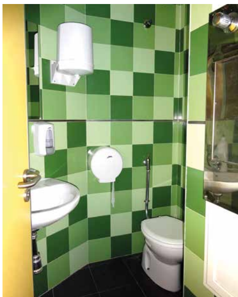
Imagen 64. UCH Sevilla-San Lázaro

El acceso a la UCH da a un pequeño recibidor frente al que se encuentra la cabina de seguridad. Dispuestos a ambos lados aparecen las puertas de cada habitación. Son metálicas