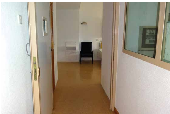
Imagen 52. UCH Jaén

Las puertas de las habitaciones de los extremos son de una hoja. Tienen un hueco de cristal y perfiles metálicos que permite una visualización de la habitación.