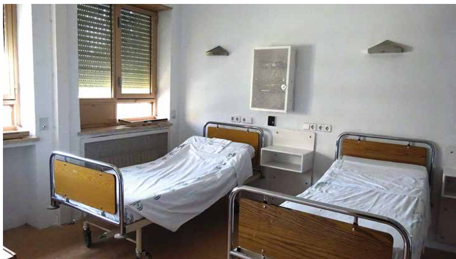
Imagen 49. UCH Jaén

La Unidad cuenta con tres habitaciones dispuestas en torno a los dos pasillos citados a partir de un pequeño recibidor. A la izquierda aparece al fondo una habitación con una cama. Otra, la derecha y al lado de la cabina de seguridad, es de "máxima seguridad" con un sola cama.