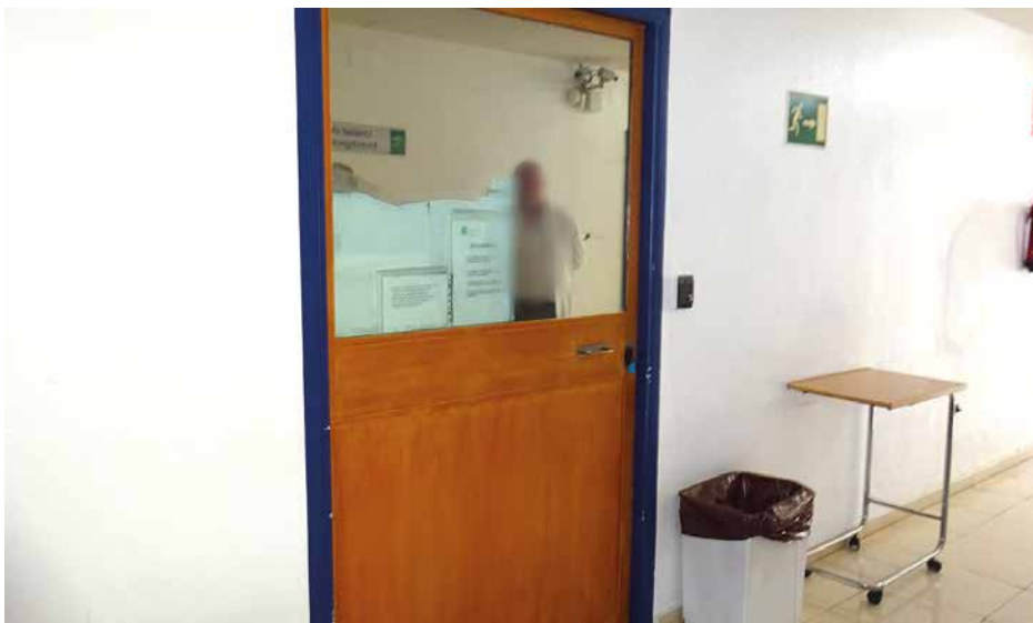
Imagen 48. UCH Jaén

La unidad visitada se encuentra en la sexta planta en el pasillo situado a la derecha de la salida de los ascensores y tras una puerta que da paso a un conjunto de dependencias. La planta está prácticamente desocupada. Sólo acoge los ingresos de enfermedad mental y algún despacho como la unidad de investigación o las dependencias del control de enfermería que sirve de apoyo a la UCH.