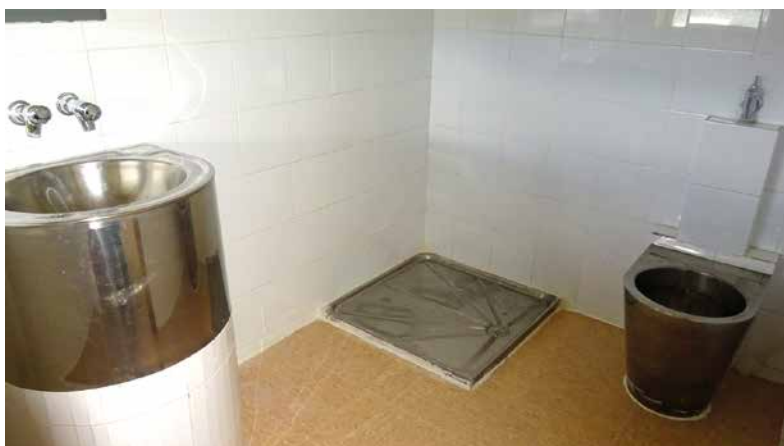
Imagen 51. UCH Jaén