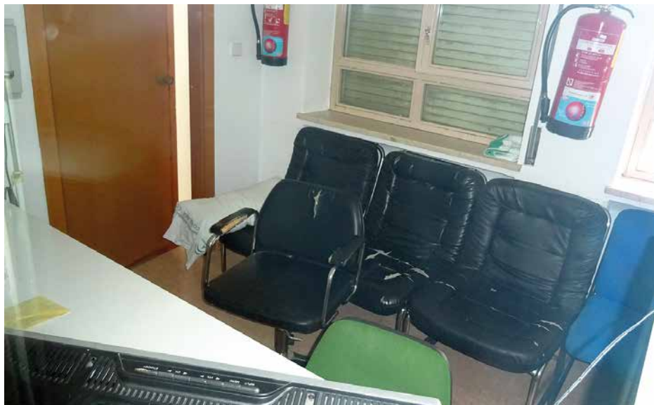
Imagen 55. UCH Jaén

Cuenta el interior de la cabina con otra habitación que no pudimos visitar ya que las llaves quedan en poder de la policía y en el momento de la visita no había servicio al no estar ingresado ningún paciente.