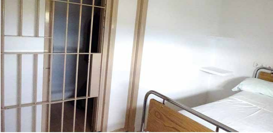
Imagen 53. UCH Jaén

Las ventanas tienen anchos pre-marcos de metal y amplios cristales de seguridad por los que se logra una buena iluminación natural. No presentan barrotes.