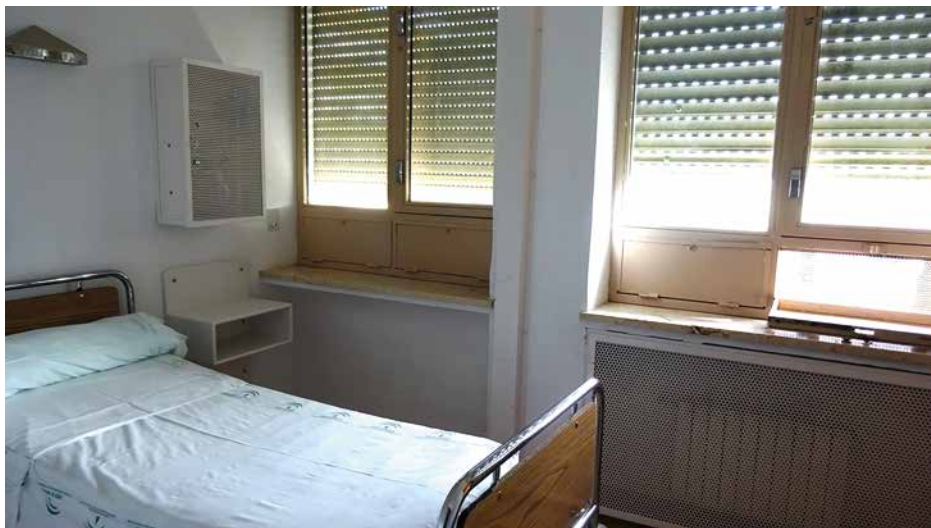
Imagen 50. UCH Jaén

En la fecha de visita no había ningún ingreso, por lo que el acceso se realizó con la colaboración de los servicios de seguridad del hospital. Obviamente, tampoco había ningún agente de servicio del CNP.