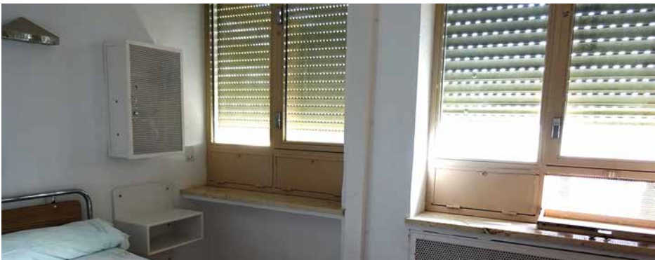
Imagen 54. UCH Jaén

Las ventanas tienen anchos pre-marcos de metal y amplios cristales de seguridad por los que se logra una buena iluminación natural. No presentan barrotes.