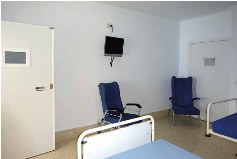
Imagen 24. UCH Puerto Real. Cádiz

Las habitaciones cuentan con dos sillones amplios. Cada habitación dispone también de televisión anclado a la pared. En dos de las habitaciones (las que se encontraban con internos ingresados) había una pequeña mesa a modo de escritorio.