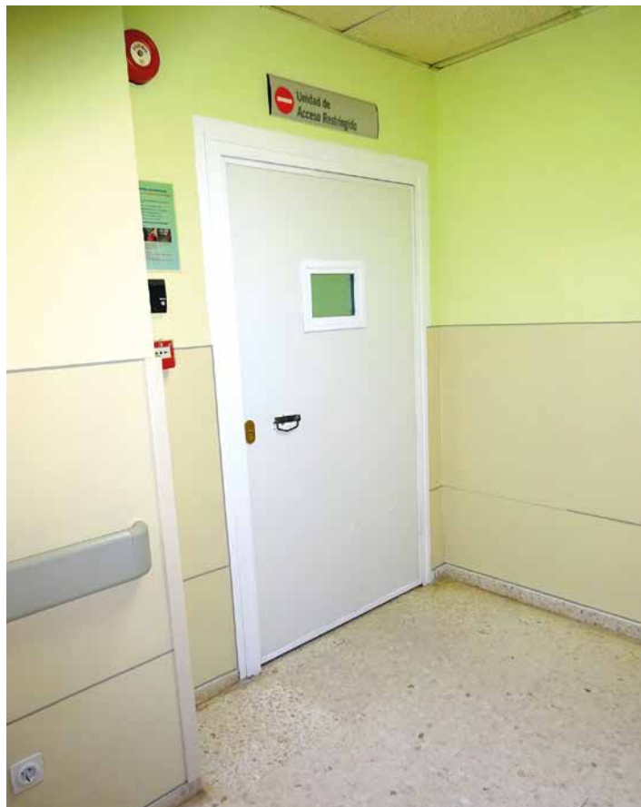
Imagen 21. UCH Puerto Real. Cádiz

Tras rebasar la puerta aparece un pasillo que en su lado izquierdo cuenta con un sistema de doce taquillas bajo llave donde depositar los objetos necesarios por parte de las personas que visitan a los enfermos ingresados.