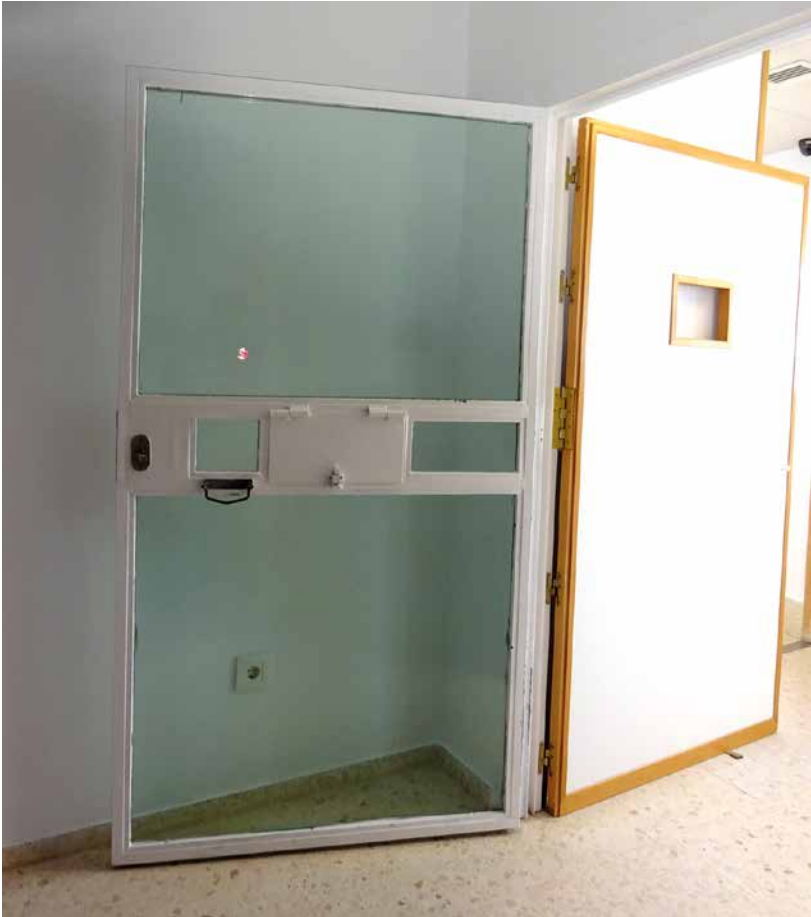
Imagen 25. UCH Puerto Real. Cádiz

Cada habitación dispone de una puerta metálica y con cerradura de llave en la que está una ventana con cristal blindado. Sobrepuesta a la puerta metálica aparece otra puerta de material traslúcido que permite aislar la habitación y controlar su interior.