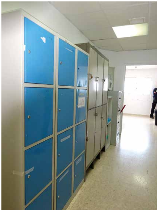
Imagen 22. UCH Puerto Real. Cádiz

exteriores a la fachada a la derecha y las puertas de acceso a dos habitaciones a la izquierda. Al fondo del pasillo izquierdo se sitúa otra habitación. Junto a la cabina aparece hacia la derecha otra habitación.