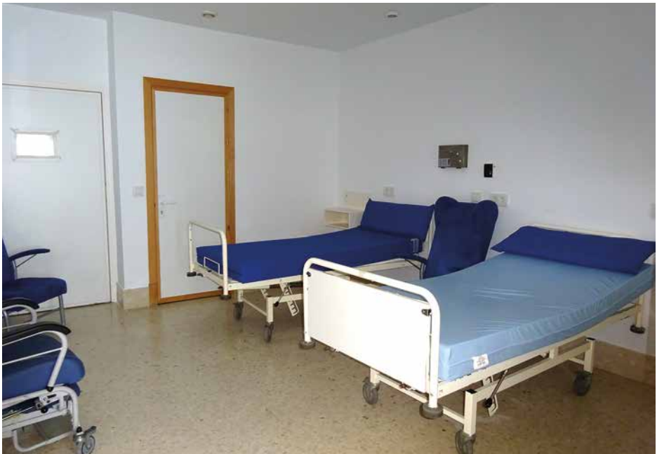
Imagen 23. UCH Puerto Real. Cádiz

En función de su ubicación, el tamaño de las habitaciones es diferente. Son amplias con un tamaño aproximado de cinco metros de largo en las paredes. Contarán con unos 25 o 30 metros cuadrados de superficie. Separado por una puerta, cuenta cada habitación con baño.