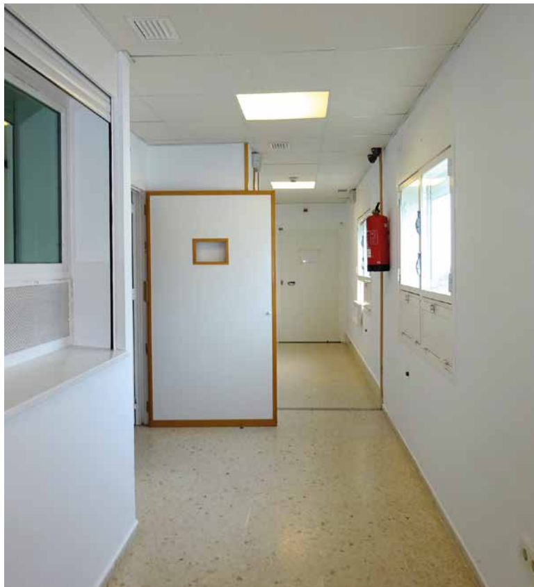
Imagen 26. UCH Puerto Real. Cádiz

Ciertamente no se aprecian rejas en la Unidad, más allá de algún hueco en las puertas de las habitaciones. Se nos informó que los cristales sí eran de seguridad, al igual que las puertas que eran de material metálico.