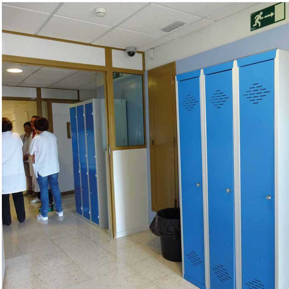
Imagen 3. UCH Almería

En la entrada aparece un pasillo a la derecha que lleva hasta una pequeña habitación que sirve para las esperas de las visitas de los pacientes. Dispone de varios asientos y está controlado por el campo de visión de una cámara de seguridad interior, conectada con la cabina de control policial.