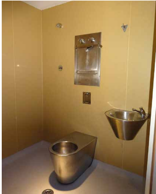
Imagen 6. UCH Almería

También aparecen los elementos de oxigenación o timbres y luces comunes de otras habitaciones y camas. Cuentan con un sillón de respaldo alto y las habitaciones están dotadas de un monitor de televisión anclado a la pared frente a la cama.