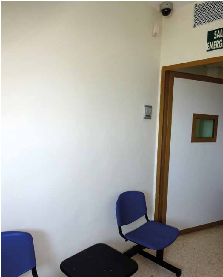
Imagen 2. UCH Almería

Se accede mediante un pulsador de aviso conectado con el control policial y entrando en un pequeño recibidor donde se encuentran un armario con seis taquillas donde depositan sus pertenencias las visitas cuando acuden a entrevistarse con los pacientes ingresados.