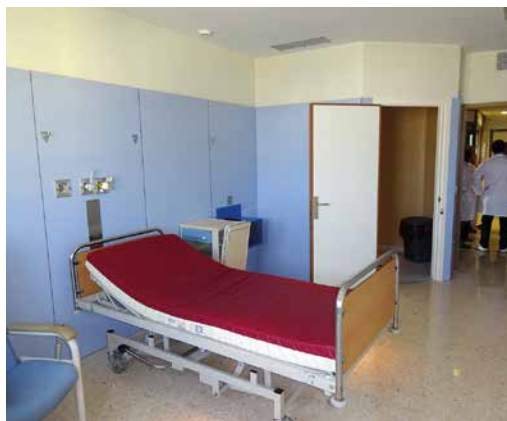
Imagen 5. UCH Almería

Cada habitación presenta un aspecto semejante al resto de las habitaciones de la planta. Junto a la cama aparece una mesa auxiliar con ruedas y panel plegable que permite comer al paciente desde la cama o realizar otras funciones de apoyo análogas.