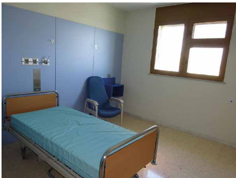
Imagen 8. UCH Almería

Las ventanas no tienen rejas. Son traslúcidas y tienen tres cristales separados por premarcos anchos.