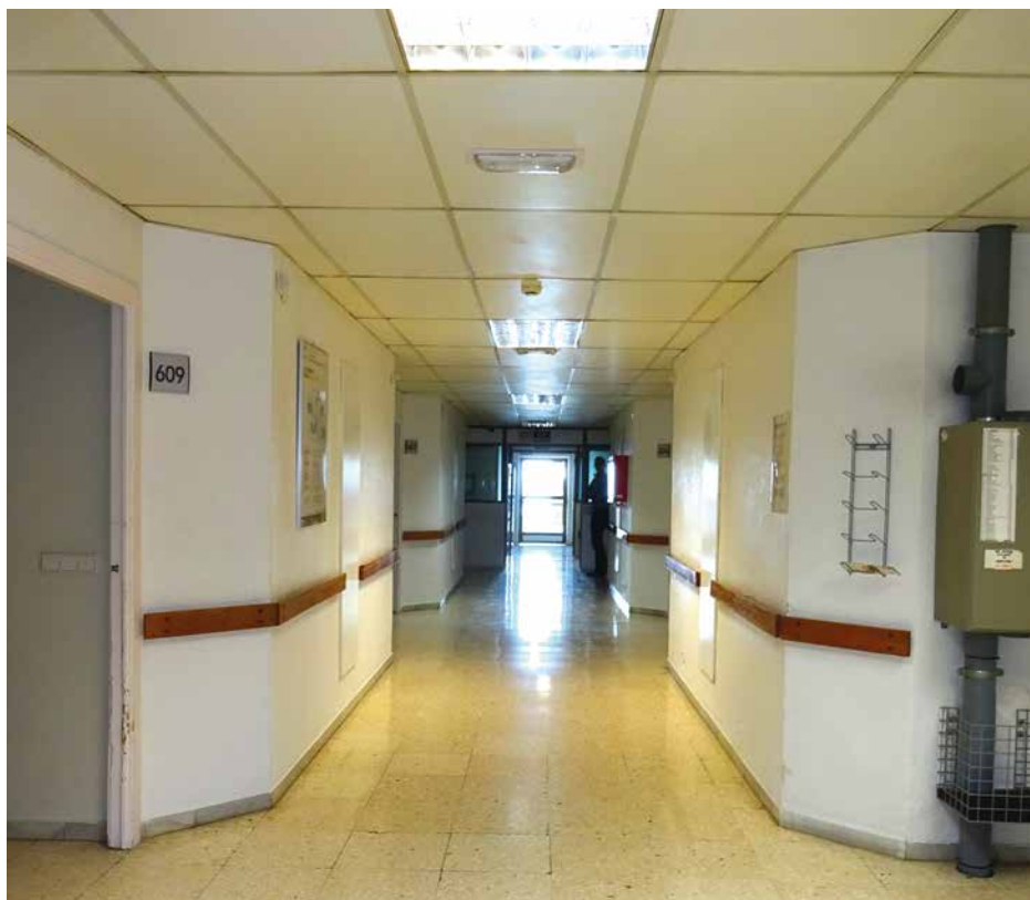
Imagen 1. UCH Almería

La UCH está ubicada en el Hospital "Torrecárdenas" , de Almería. Concretamente en la sexta planta, dedicada principalmente a Traumatología.