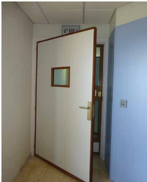
Imagen 7. UCH Almería

control. La apertura de la sobrepuerta permite contemplar el interior de la habitación desde el pasillo exterior.