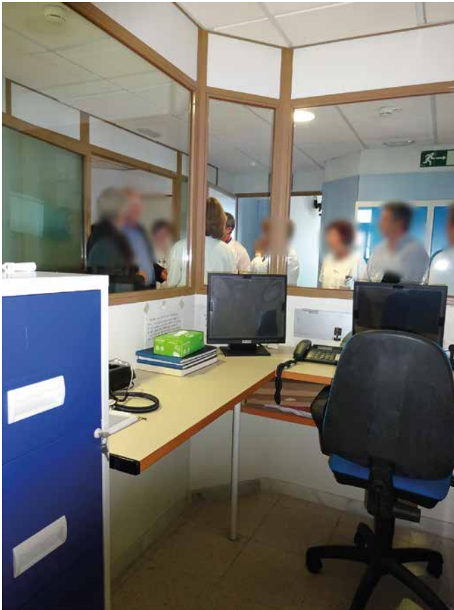
Imagen 10. UCH Almería

Los profesionales que nos acompañaban a la visita no conocían el régimen horario de los policías. Su presencia o los relevos no son controlados ni registrados por el personal hospitalario, ya que dependen de los mandos policiales.