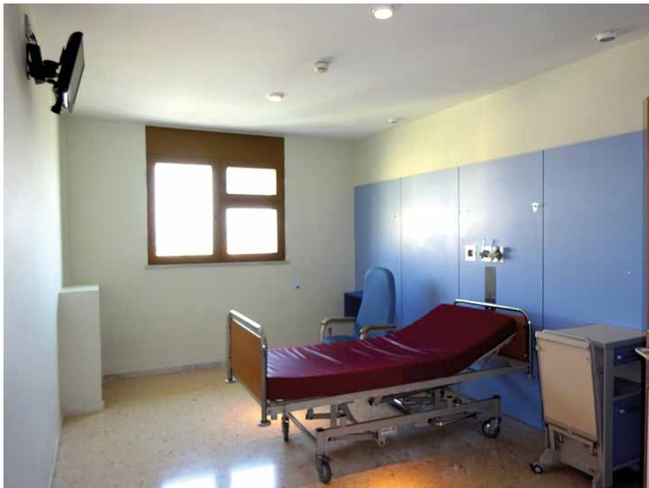
Imagen 4. UCH Almería